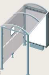
Porquerolles - Longueur 2500 Caisson d'information lumineux sur pied central 529348