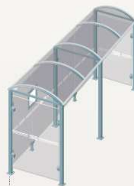
Noirmoutier - Longueur 5000 Deux bardages latéraux 529319