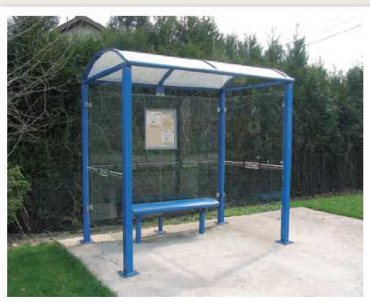
Modèle présenté : Noirmoutier - RAL 5010 - réf. 529318