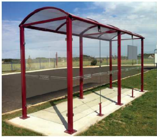
Modèle présenté : Oléron - RAL 3004 réf. 529309