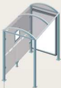
Ouessant - Longueur 2500 Une vitrine 2000 529328