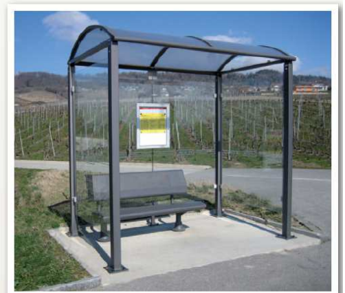
Modèle présenté : Noirmoutier-Gris PROCIITY réf. 529318