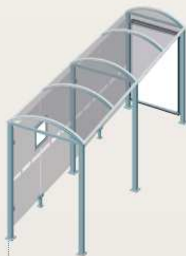
Ouessant - Longueur 5000 Une vitrine 2000 529329