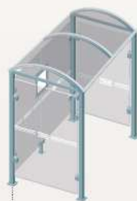
Noirmoutier - Longueur 2500 Deux bardages latéraux 529318