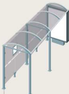
Porquerolles - Longueur 5000 Caisson d'information lumineux sur pied central 529349