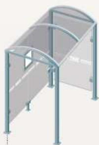
Oléron - Longueur 2500 Un bardage latéral 529308