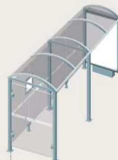
Port-Cros - Longueur 5000 Caisson d'information lumineux sur pied central + un bardage latéral 529359