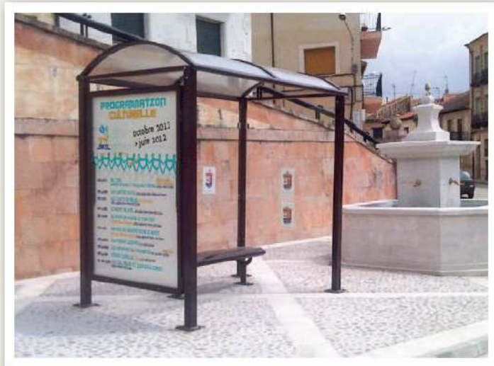
Modèle présenté : Lérins - RAL 8017 - 529338