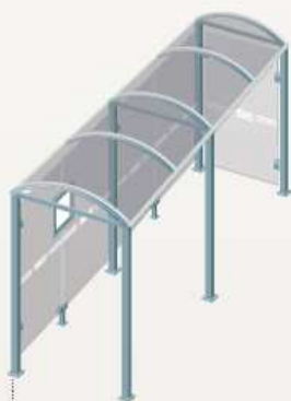
Oléron - Longueur 5000 Un bardage latéral 529309