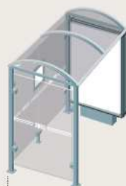
Port-Cros - Longueur 2500 Caisson d'information lumineux sur pied central + un bardage latéral 529358