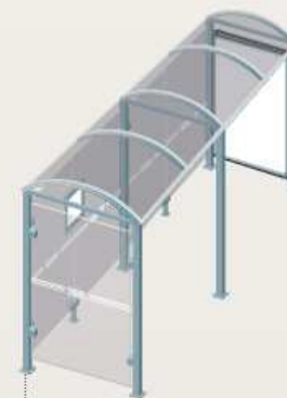
Lérins - Longueur 5000 Une vitrine 2000 + un bardage latéral 529339