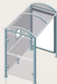
Lérins - Longueur 2500 Une vitrine 2000 + un bardage latéral 529338