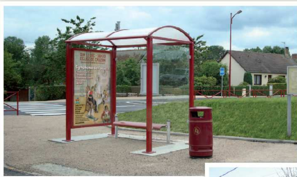
Modèle présenté : Lérins - RAL 3004 réf. 529338