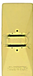
Socle à poser ou visser