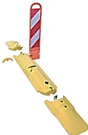
Séparateur à liaisonner